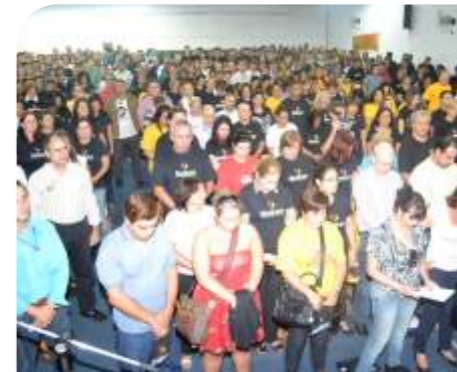
Minuto de Silêncio - ABR/2011