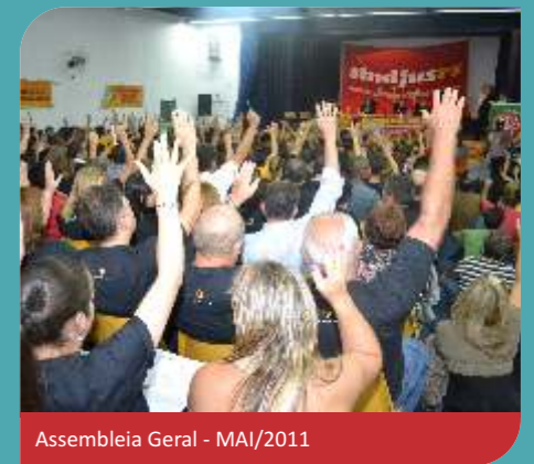
Assembleia Geral - MAI/2011