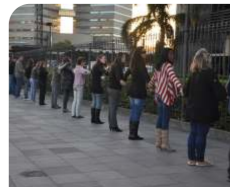
Abrço ao TJRS - JUN/2011