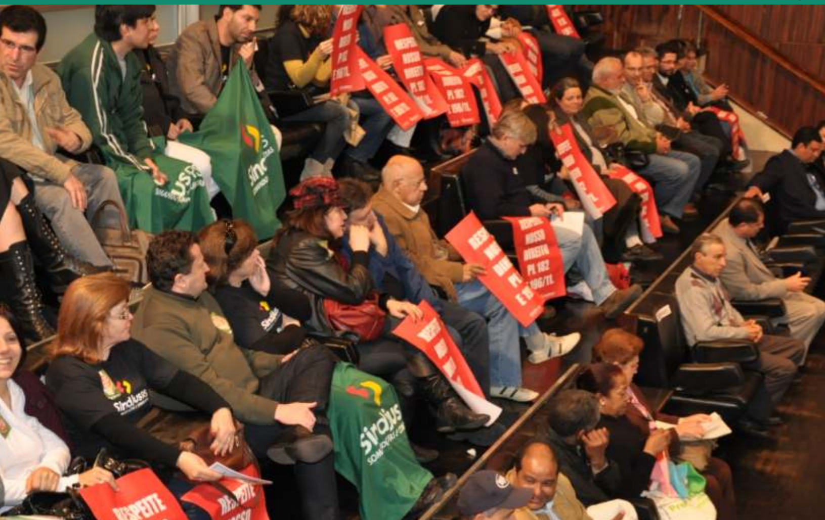
Trabalhadores acompanham a votação do PL

Novembro de 2010. Em assembleia geral, os trabalhadores do Judiciário decidem se posicionar contra a automaticidade do reajuste dos subsídios dos magistrados e dar início à campanha salarial. Era o início de uma intensa luta que,