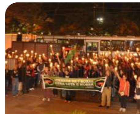
Ato das luzes em frente ao TJ - MAI/2011