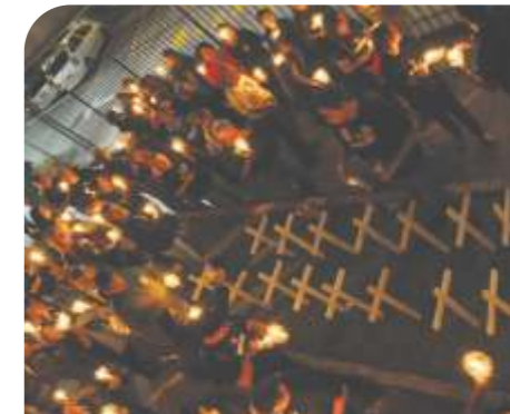
Ato TJRS - MAI/2011