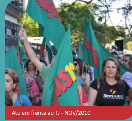
Ato em frente ao TJ - NOV/2010