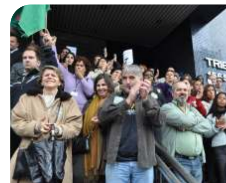
Ato em frente ao TJRS - MAI/2011