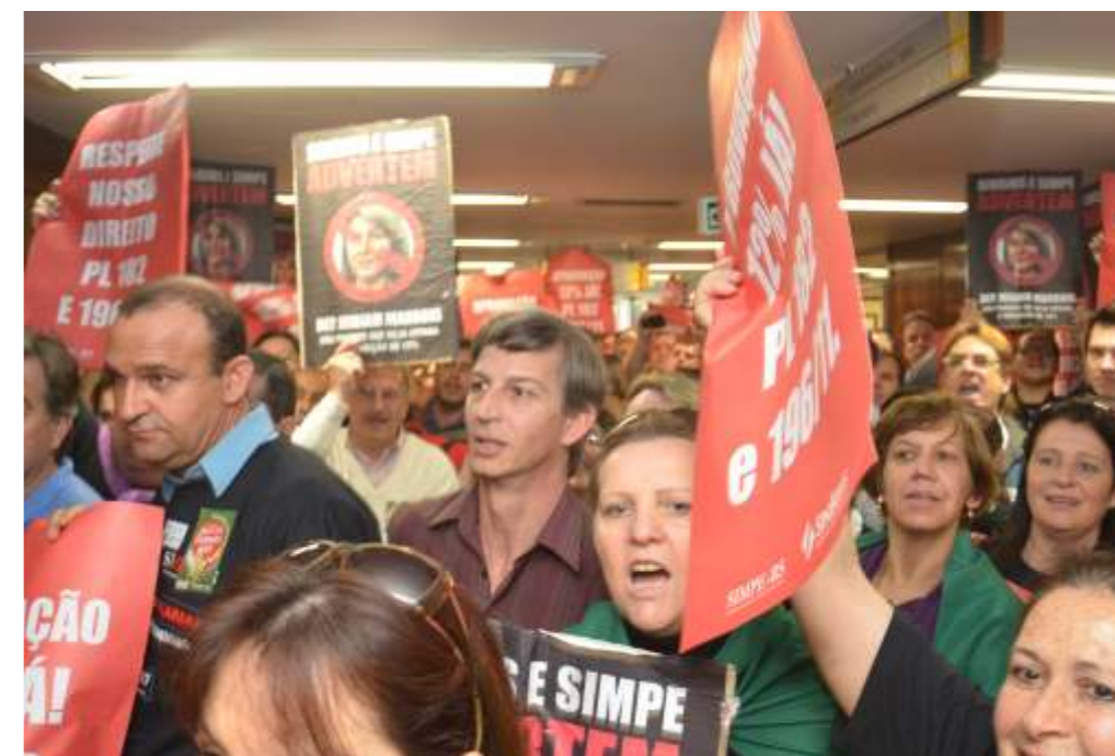
Manifestação na reunião de líderes

Durante toda a jornada de luta, os trabalhadores renderam homenagens aos colegas que faleceram duran-