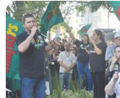
Ato em Frente ao TJ - ABR 2011