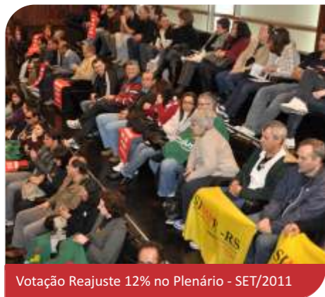
Votação Reajuste 12% no Plenário - SET/2011