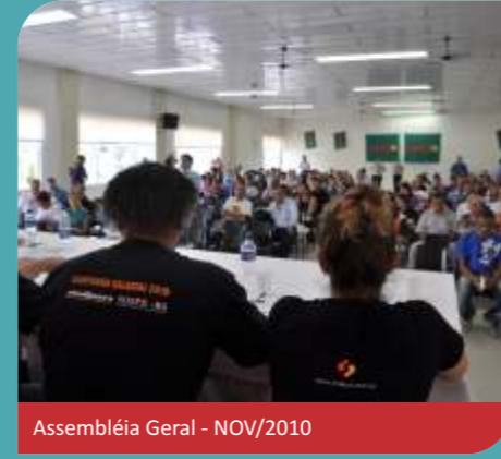
Assembléia Geral - NOV/2010

Lutamos muito para garantir os 12% de reposição. Nesta caminhada, garantimos nosso reajuste, que repõe parte de nossas perdas, mas principalmente, nos fortalecemos como categoria para enfrentar os próximos desafios. O Sindjus/RS parabeniza a todos que somaram nesta luta e desde já convoca os trabalhadores para continuarem mobilizados.