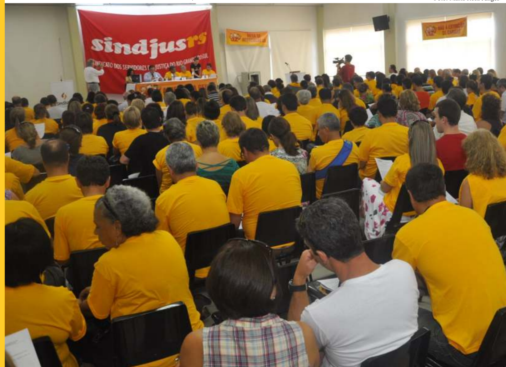
Assembleia aprovou substitutivo