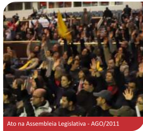
Ato na Assembleia Legislativa - AGO/2011