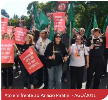
Ato em frente ao Palácio Piratini - AGO/2011