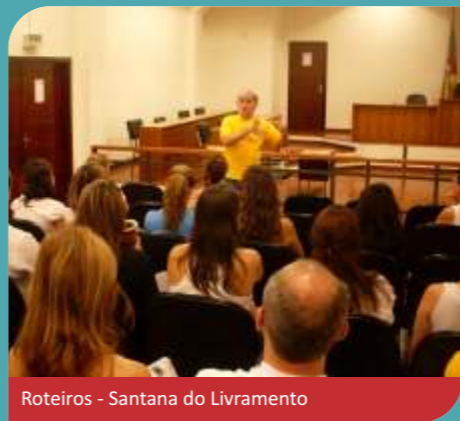
Roteiros - Santana do Livramento