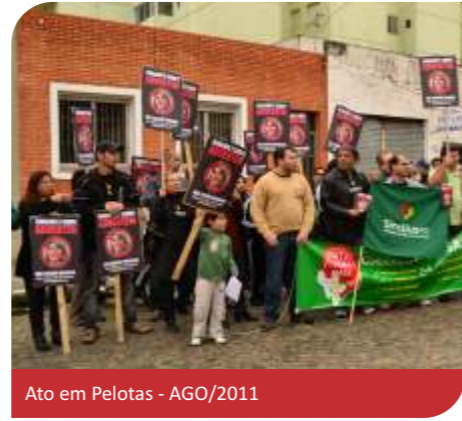
Ato em Pelotas - AGO/2011