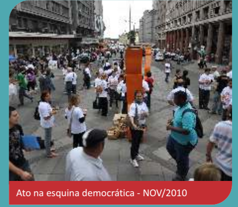
Ato na esquina democrática - NOV/2010