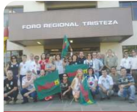
Foro Regional Tristeza