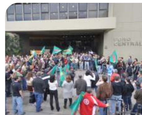
Ato em frente ao Foro Central - MAI/2011