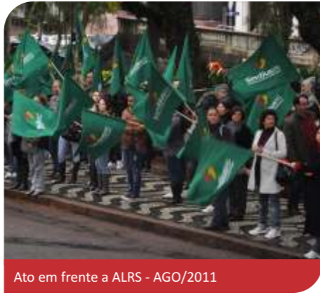
Ato em frente a ALRS - AGO/2011