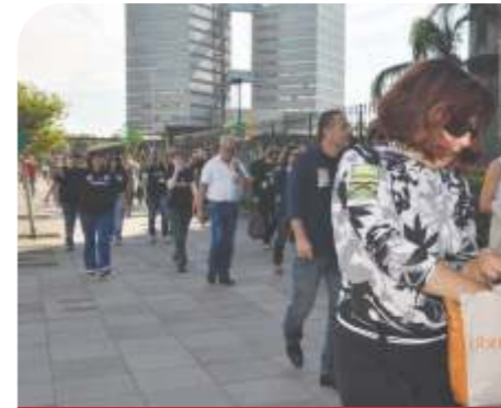
Ato TJRS - ABR/2011