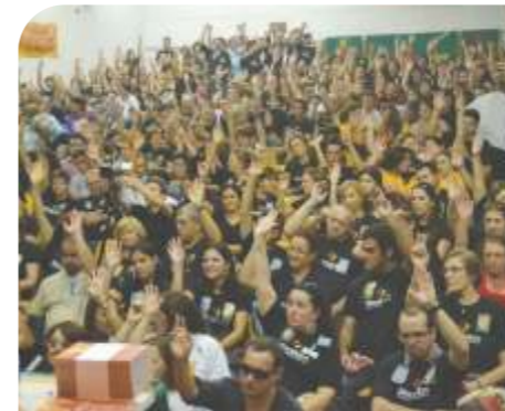
Assembleia Geral - ABR/2011