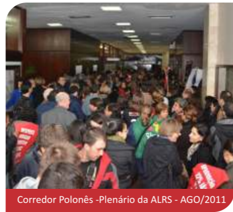
Corredor Polonês - Plenário da ALRS - AGO/2011