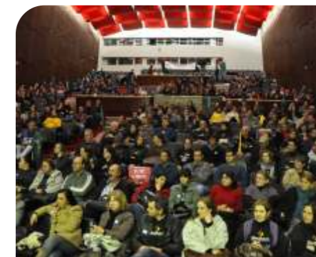
Assembleia Geral na ALRS - AGO/2011