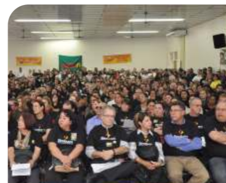
Assembleia Geral - MAI/2011