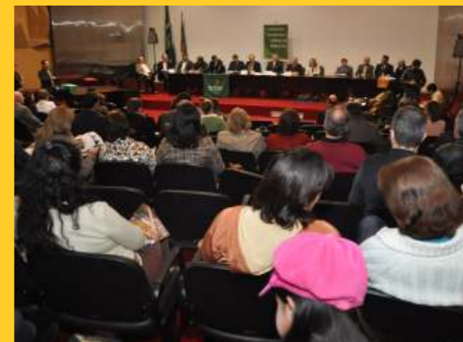
Audiência Pública em Passo Fundo - 08.09.2011

Foi realizada, dia 8 de agosto, audiência pública da Comissão de Segurança e Serviços Públicos da Assembleia Legislativa no Fórum de Passo Fundo, para debater a situação da comarca. Durante o encontro foi revelada a caótica situação a que estão submetidos os trabalhadores. Com algo em torno de 80 mil proces-