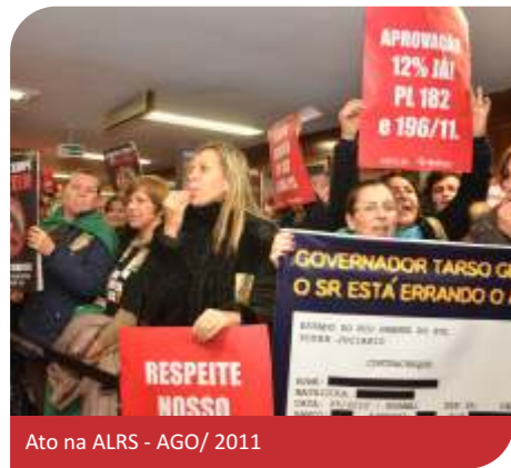
Ato na ALRS - AGO/2011