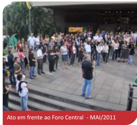
Ato em frente ao Foro Central - MAI/2011