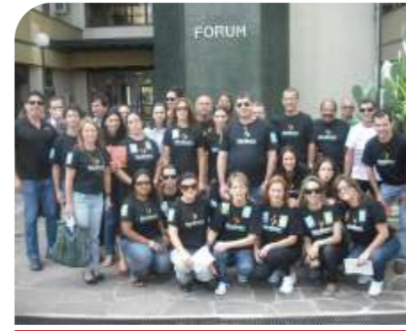
Santana do Livramento