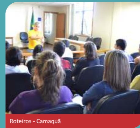
Roteiros - Camaquã