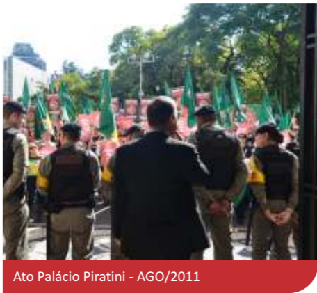
Ato Palácio Piratini - AGO/2011